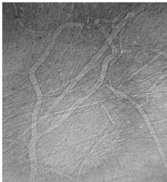
3. ábra. Patkány fülében található finom érhálózat leképezése röntgenfáziskontraszt-módszerrel.