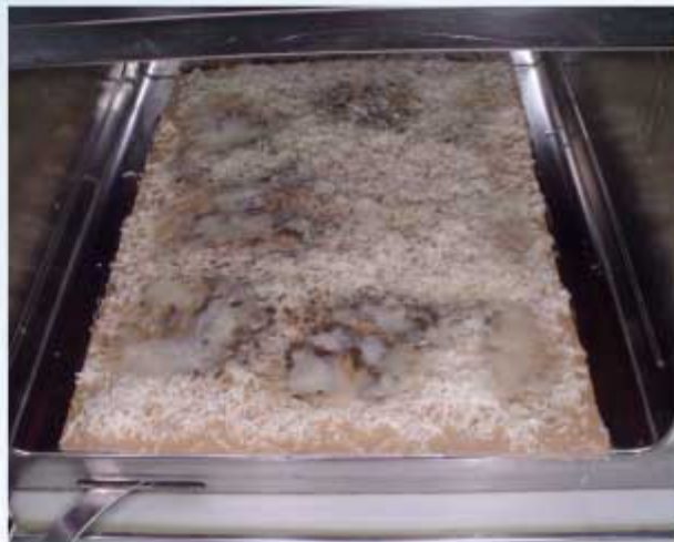
3. ábra. Mikrohullámú sütő állóhullámképe, a duzzadóhelyeken megolvad a sajt. További képek láthatók a http://jedlik.phy.bme.hu/~hartlein/mikro webhelyen.

Két üvegpohárba töltünk paraffint és glicerint. Mindkettőt helyezzük be a mikrohullámú melegítőbe, és melegítsük körülbelül fél perccig! Amikor kivesszük a két poharat, azt tapasztaljuk, hogy a paraffinolaj hideg maradt, a glicerint felforrósított. Az egyformának kinéző – hasonló sűrűségű és viszkozitású, átlátszó – folyadék eltérő viselkedésének magyarázata azok molekulaszervezetében keresendő. A paraffinolajban ( \text{CH}_3-(\text{CH}_2)_n-\text{CH}_3 ) apoláros kö-