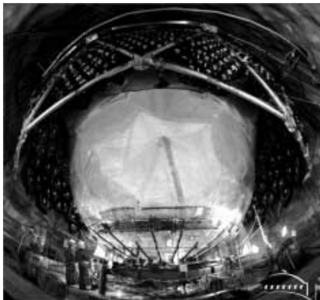
4. ábra. A Sudbury Neutrino Observatory (Kanada) 1000 t nehézvízzel feltöltött tartálya, amelyben a Naphól érkező neutrínók bármely fajtája reakciót vált ki, így lehetőség van a teljes neutrínófluxus észlelésére.

kov-detektorokból származó információt kiegészítik a légköri molekulák röntgenfluoreszcens sugárzását 15 km magassáig észlelni képes teleszkópok (3. ábra). Ezekkel a záporok légköri kifejlődését lehet nyomon követni, amivel a Cserenkov-detektorok közötti tartományban leérkező (tehát általuk nem észlelt) részecskék eloszlására kiegészítő információ kapható. A széles nemzetközi együttműködésben felépített és működtetett intézményhez az érdeklődő hazai asztrofizikusok Mészáros Péterrel , a Pennsylvania State University magyar–amerikai–argentín professzorával, az ELTE vendégprofesszorával végzett közös kutatómunka révén tudnak kapcsolódni.