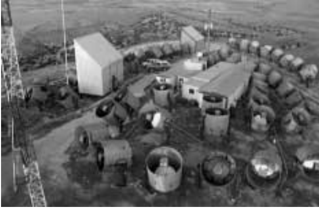
2. ábra. A Légyszem (Fly's Eye) kozmikus sugárzási detektortelep. A jól megkülönböztethető tartályokban haladó töltött részecskék keltette Cserenkov-sugárzás révén mérik a zápor részecskéinek sebességét, amelyből számított mozgási energia segítségével számolják vissza a záport indító kozmikus részecske energiáját.

jú földi részecskegyorsító, a Nagy Hadron Ütköztető (LHC) Genfben, amellyel 100 TeV-es ( 10^{14} eV-os) protonokat állítanak majd elő. A 1990-es évtized elején angliai és japán kutatók 10^{21} eV-ot meghaladó energiájú zápor-események méréséről is beszámoltak.