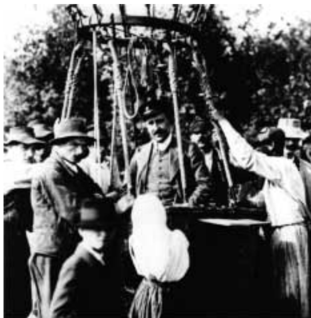
1. ábra. V.F. Hess (középen) léghajójával, amelyen a Föld magaslégkörében jelenlévő ionizáló sugárzást felfedezte.

Az egyre nagyobb kiterjedésű detektormezőkön egymással összefüggésben (koincidenciában) észlelt részecskék energiáinak összességéből rekonstruálható a záport indító részecske energiája. A végső részecskék energiáját a víztartályokbeli ütközésük során meglökött töltött részecskék Cserenkov-sugárzásának elemzéséből lehet megmérni, amivel még a bejövő részecske érkezési irányára is következtetni lehet. A sok évtizedes, egyre tökéletesedő észlelési technikát használó kutatás eredménye az, hogy mindig találtak egy előzetesen elképzelt többszöröse határenergiát meghaladó energiájú elsődleges részecskét, bár az energia növekedésével egyre csökkent előfordulási gyakoriságuk. Így 1991-ben a Utah állambeli (Egyesült Államok) Fly's Eye (összetett légy szemre emlékeztető struktúrájú) detektorral (2. ábra) 10^{19} eV összenergiájú záport észleltek. Összehasonlításul: 2007 őszén kezd meg működését a mindaddig legnagyobb energiá-